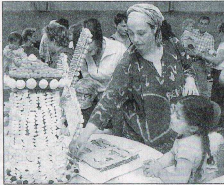
La journée s'est terminée par un grand goûter salle des échevins

Le pari semble réussi. Le livre a rapproché les nounous et leur a permis de faire un bilan personnel de leur activité. « On a évoqué les bons comme les mauvais souvenirs. Parfois on demandait à une autre de faire lire notre texte car il y avait trop d'émotion », révèle une nounou. Une autre, qui avait des difficultés en lec-