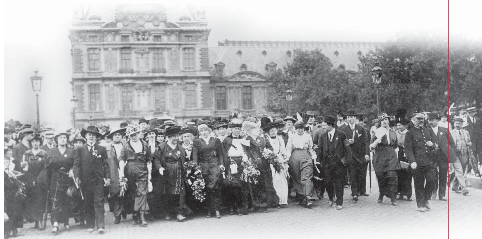
MANIFESTATION POUR LE DROIT DE VOTE DES FEMMES [JUILLET 1914]

Mars 2015 les conseillers départementaux seront intégralement renouvelés, au scrutin binominal mixte, sur des cantons redécoupés afin de garantir la parité.